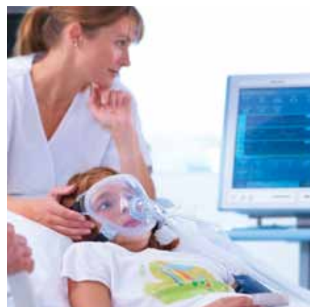
Применение НВЛ в педиатрии