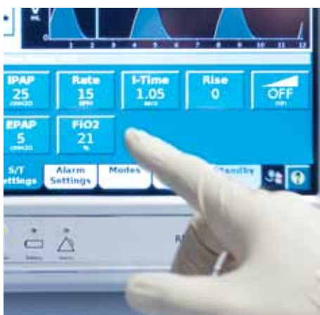
Простая настройка параметров с помощью крупных элементов управления на экране