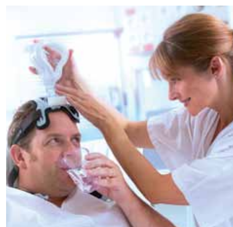
Режим ожидания, используемый во время общения пациента и врача