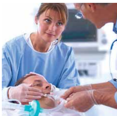
Инвазивный и неинвазивный режимы вентиляции для интенсивной терапии