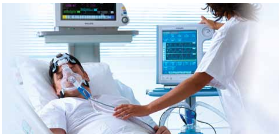
Продолжительная вентиляция в режимах AVAPS и PCV